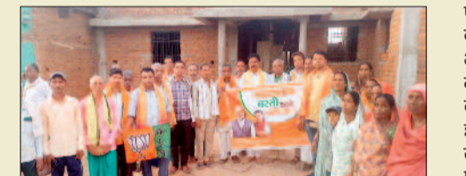
गलियों और घर घर दस्तक देकर पहुंचा रही है। आमजन को केंद्र एवं राज्य सरकार की विभिन्न योजनाओं का लाभ उठाने के लिए